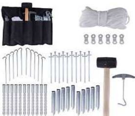
50 tlg. Zelt Aufbau Set